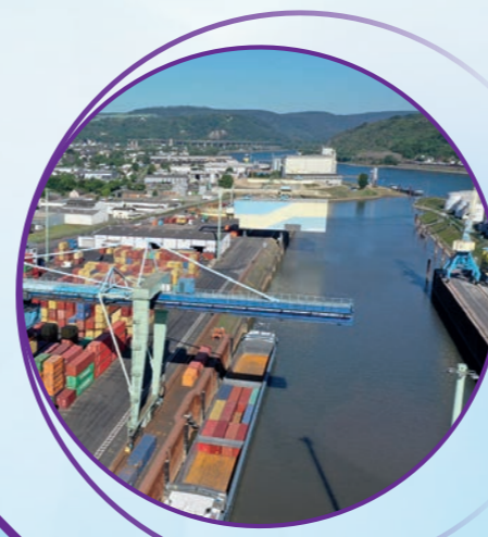
Straße, Schiene, Schiff - Trimodaler Hafen Andernach

*1964 wurden erstmals 58 Stahlcontainer auf einem Schiff transportiert. Heutige Mega-Carrier fassen rd. 22.000 Container.